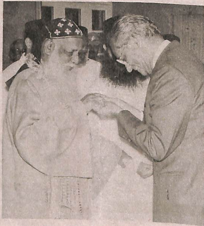
ഗവർണ്ണർ ഡോ: പി. സി. അലക്സാണ്ടർ പ. ബാവായെ ഹാരാർപ്പണം ചെയ്തശേഷം കൈമുത്തുന്നു.